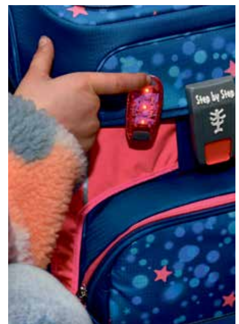
Ausstattungen zur optimalen Sicherheit