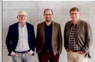
Mahrer Treuhand AG