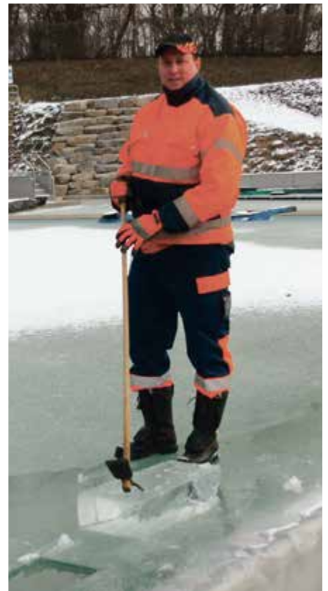
Winter 2012: Wenns Wasser gfringt