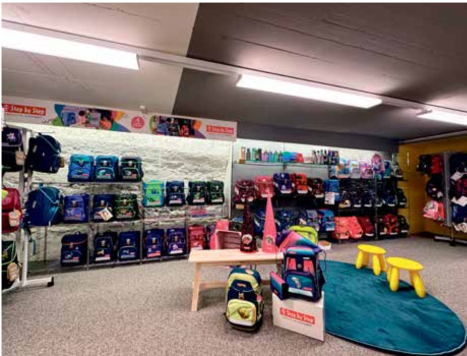
Vielseitige Auswahl im Untergeschoss der Altstadt Papeterie in Rheinfelden