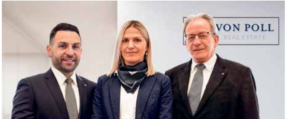
Unser Team in Rheinfelden

Das erweiterte Service-Angebot für Eigentümer bietet ein neues Mass an Transparenz zum grössten und emotionalsten Vermögenswert – der eigenen Immobilie. Durch eine 360-Grad-Analyse erhalten Eigentümer neben einer ersten indikativen Marktpreiseinschätzung umfassende Informationen zur Umgebung, Infrastruktur sowie zu geografischen und sozioökonomischen Faktoren. Ebenso stehen ein Einblick in die Vermarktungsdauer und ein Immobilienwertrechner zur Verfügung, der potenzielle Investitionsvorhaben auf ihre Rentabilität hin überprüft. Das Profil der eigenen Immobilie kann jederzeit und überall mit Familie, Treuhänder und Freun-